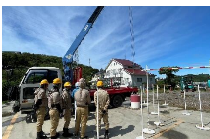
小型移動式クレーン