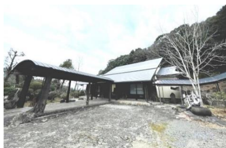
高知建機技能センター 教習所

宿泊希望者には、宿泊施設・移動手段をご紹介します。必要であれば、お気軽にお問い合わせください。