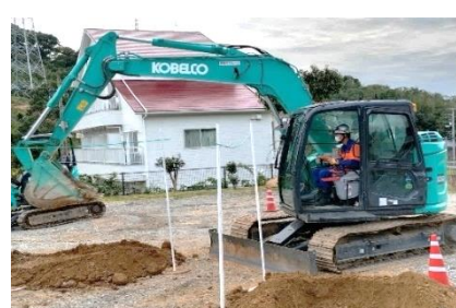
車両系建設機械(整地等)